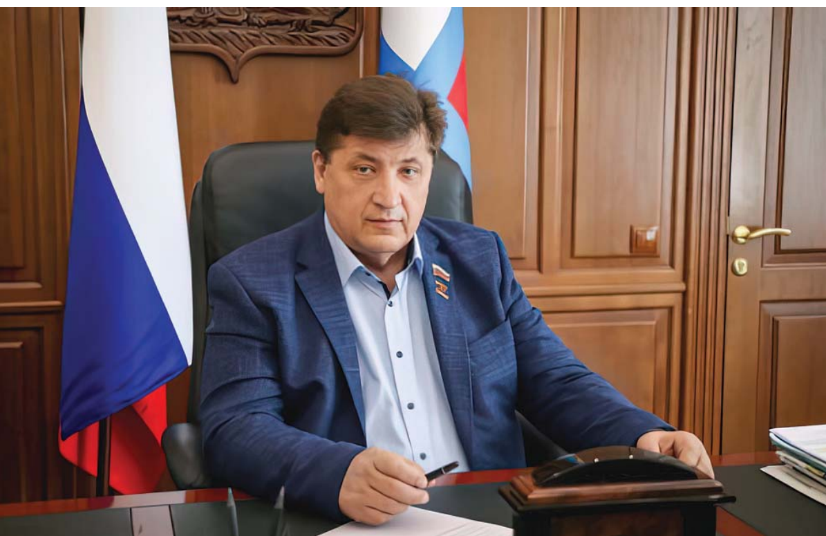
Юрий Клепиков