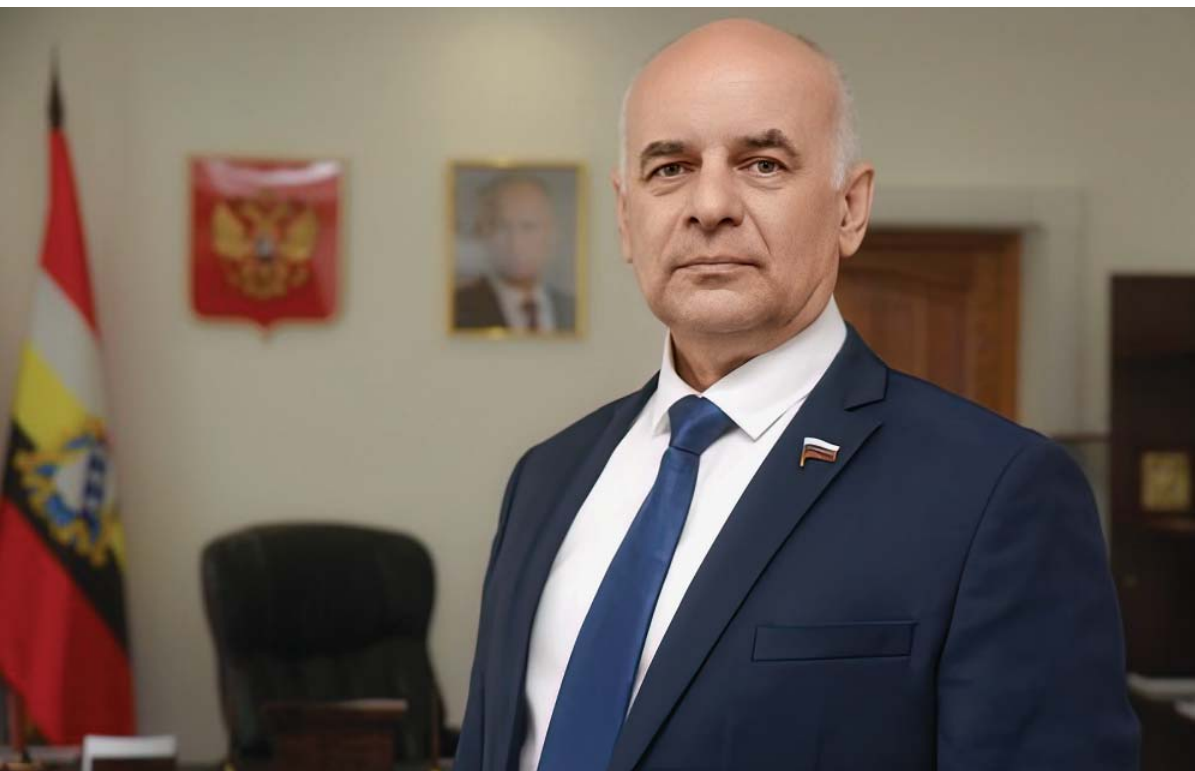
Юрий Америк